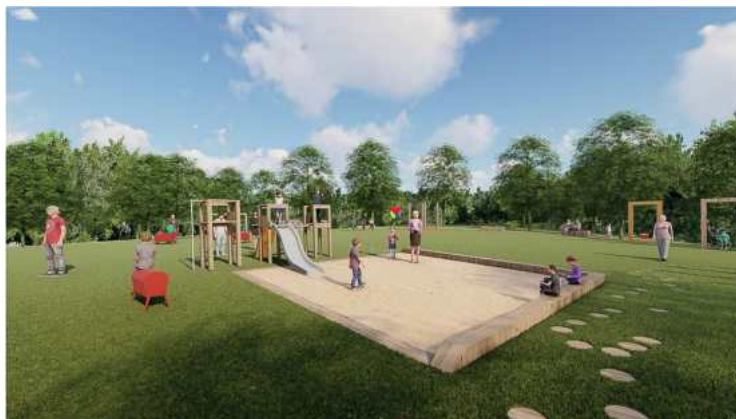
Vizualizace revitalizace Vodojemu.

Město postupně revitalizovalo parky v centru i hlavní městský park, Mercandinovy sady, a nyní se úpravy dočká i Vodojem. Na ústředním oválu bude nová cesta po obvodu s habrovým plotem a řada herních prvků pro děti, včetně pískoviště. Architekti Krejčířikovi se inspirovali při jejich rozmístění historií, konkrétně významnými stavbami centra města.